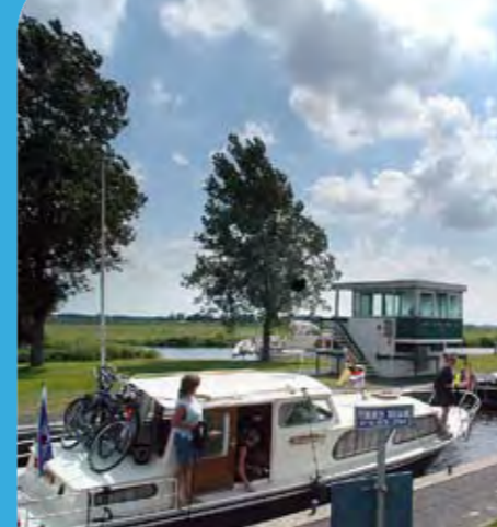
Die Linthorst Homansschleuse bei Nijetrijne